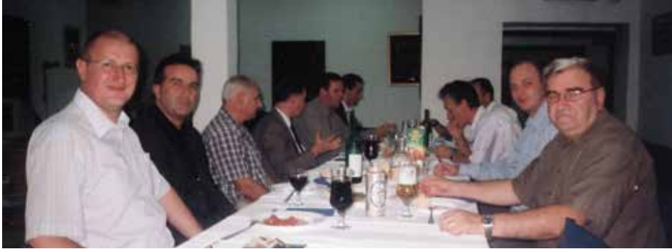
Šednica koordinacionog odbora Pokreta za nezavisnu evropsku Crnu Goru u kancelariji Matice, 2005. godina