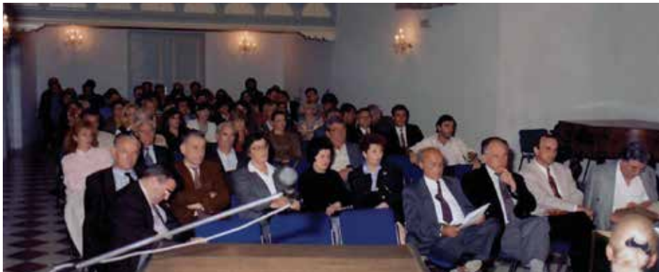
Promocija izdanja Matice crnogorske u Kotoru, 1995. godine