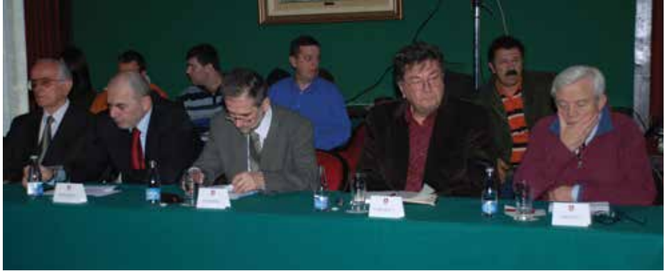
Okrugli sto Matice Ustav Crne Gore – potvrda identiteta, Podgorica 26. 01. 2007. godine