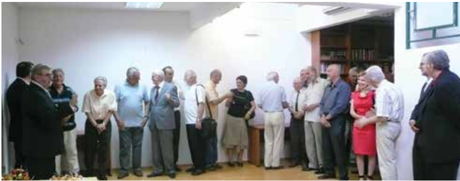
22. maj – Dan Matice crnogorske, 2009. godine