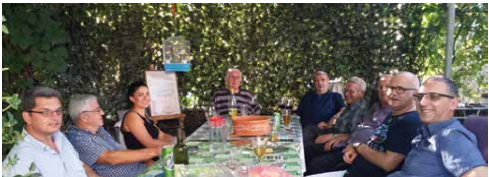
Tradicionalno druženje na Cetinju, 2018. godina