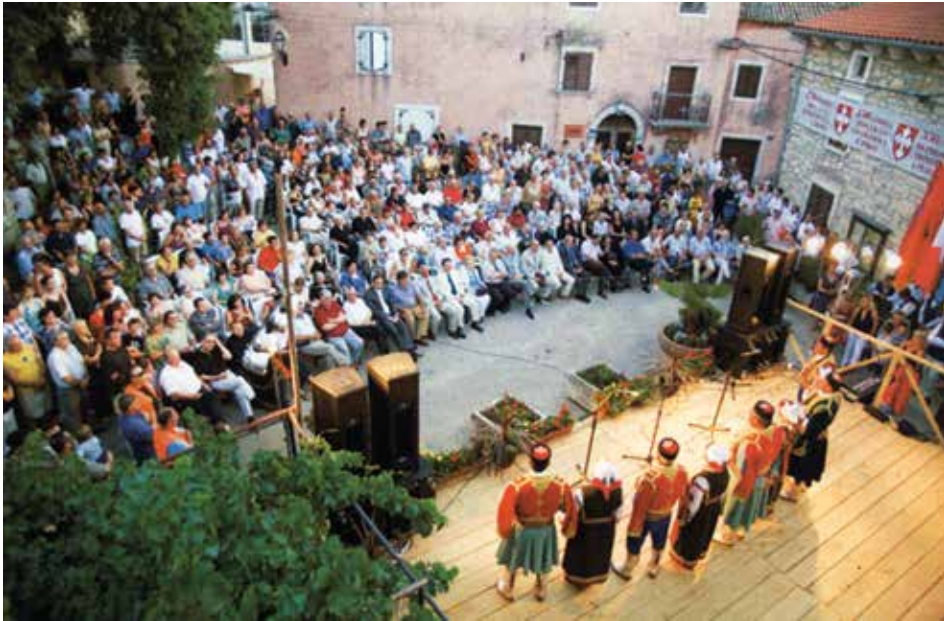
Peroj – 350 godina od doseljavanja Crnogoraca u Peroj, jul 2007. godine