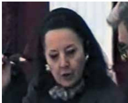
Svetlana Kana Radević predšedava Skupštinom na Cetinju, 1999. godina