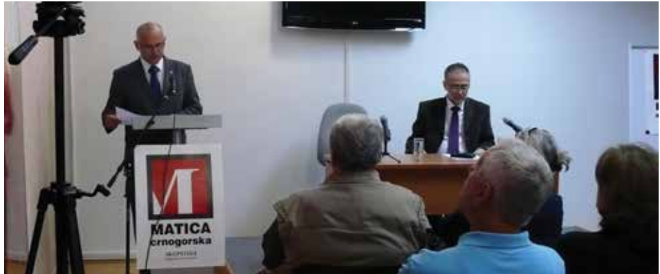
Skupština Matice crnogorske, 30. 05. 2015. godine