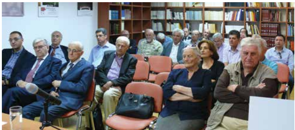
Skupština Matice crnogorske, 2015. godine