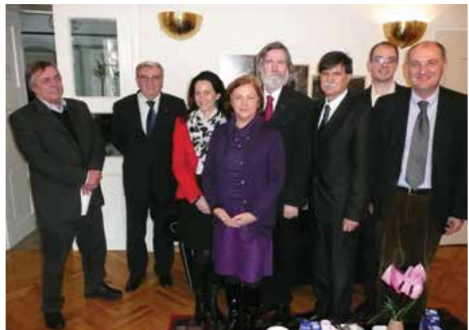
Predstavnici matice slovenskih naroda na Forumu slovenskih kultura, Ljubljana, 2012. godina