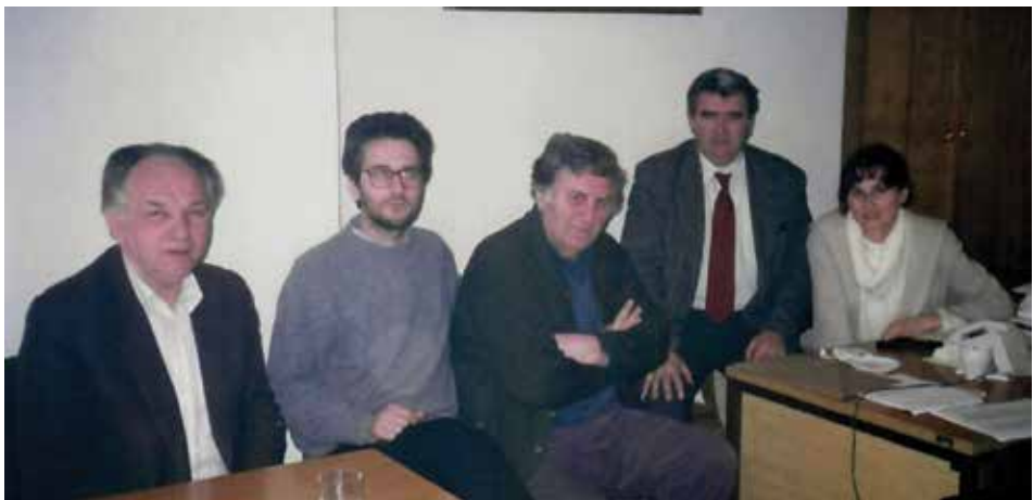
Matica crnogorska se selila petnaest puta - u kancelariji u Montex-u, 1996. godine