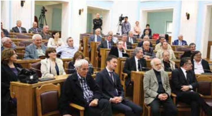
Sa Skupštine na Cetinju, 2013. godina