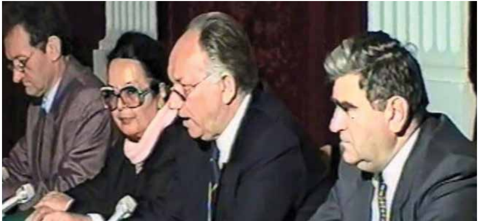
Sa Skupštine Matice crnogorske, Cetinje, 15. 10. 1994. godine