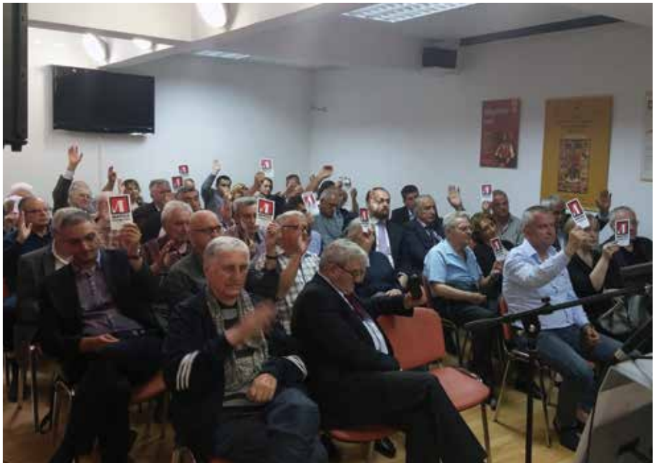
Glasanje na skupštini Matice, 2017. godina