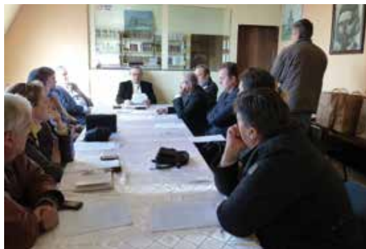
Osnivačka skupština Ogranka Mojkovac, 23. 10. 2010. godine