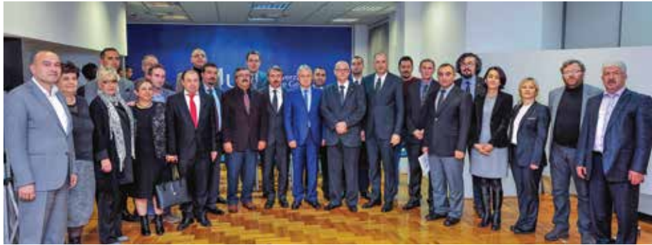
Učesnici i organizatori skupa Crna Gora i Osmansko carstvo , Rektorat Univerziteta Crne Gore, Podgorica, 24. 11. 2015. godine