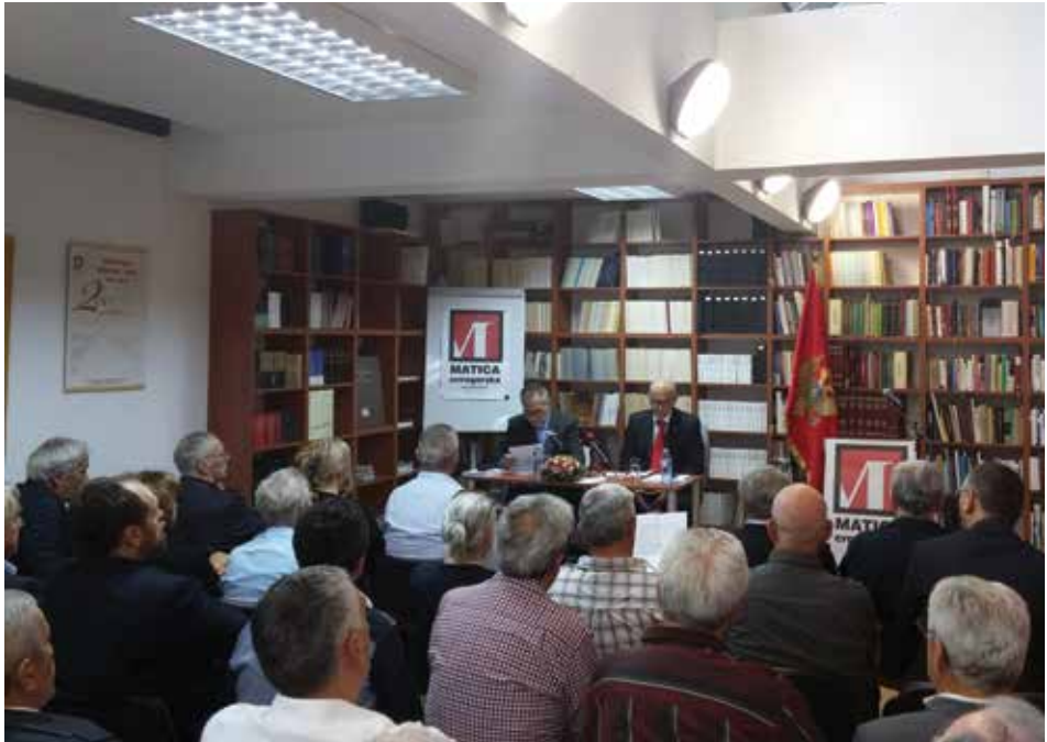
Otvaranje Skupštine Matice crnogorske, Podgorica, 3. 06. 2017. godine