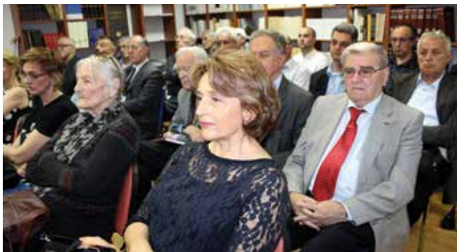
Sa Skupštine Matice crnogorske, 2016. godina