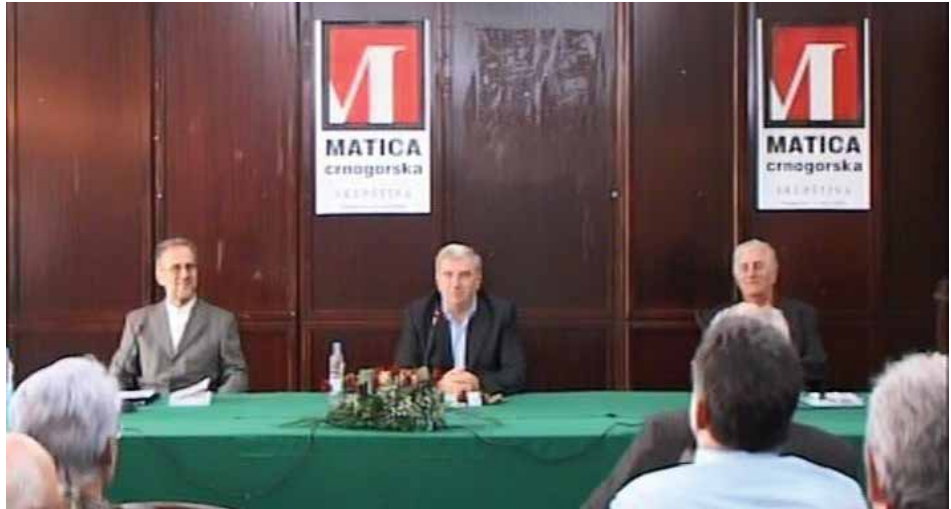
Predsjedništvo Matice na Skupštini, Podgorica 22. 05. 2008. godine