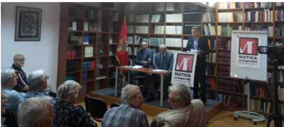
Skupština Matice crnogorske, Podgorica, 23. 06. 2018. godine