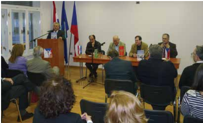
Sa promocije knjige Františka Šisteka Naša braća na jugu , Zagreb 2010. godine