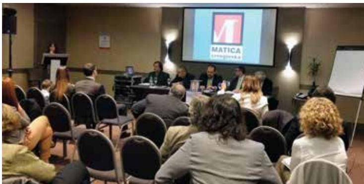
Sa skupa Matice crnogorske Potomci crnogorskih iseljenika u zemljama Latinske Amerike i identitet budućih generacija , Buenos Ajres, Argentina, 13. 05. 2016. godine