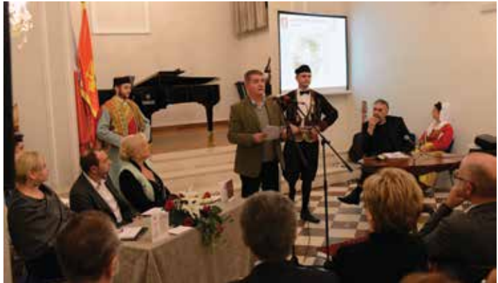
Svečana akademija povodom 200 godina ujedinjenja Crne Gore i Boke, Kotor, 2013. godina