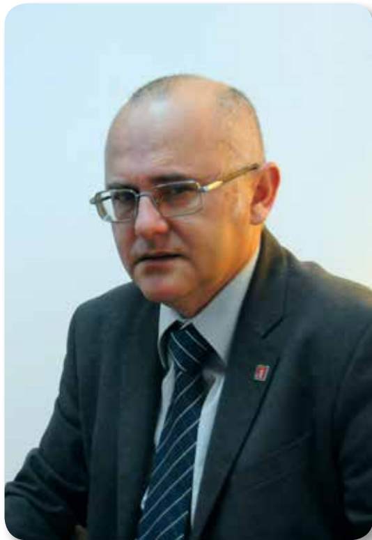
Dragan Radulović Predšednik Matice crnogorske 2013-