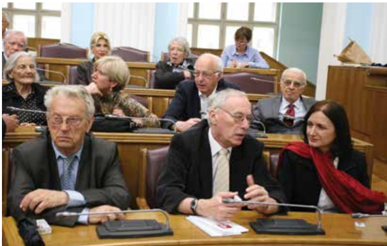
Sa Skupštine na Cetinju, 2013. godina