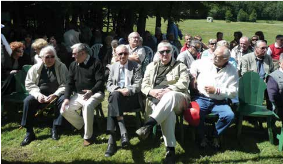
Rukovodstvo Matice na Petrovdanskim susretima, Platak, Hrvatska 2008. godine