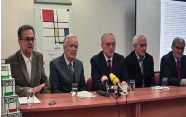
Sa večeri povodom 10 godina od izlaženja časopisa Matica , Podgorica 2009. godine