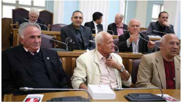
Sa Skupštine na Cetinju, 2013. godina