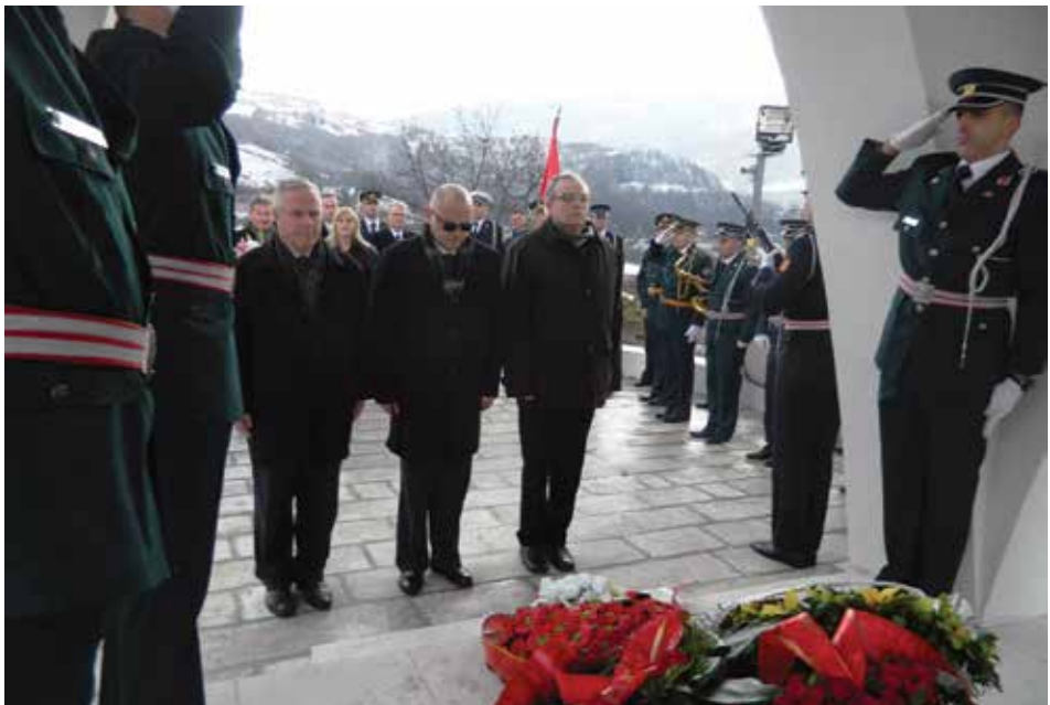
Delagacija Matice crnogorske polaže vijenac na spomenik mojčkovačkim junacima povodom 100 godina Mojčkovačke bitke, Mojčkovac, 7. 01. 2016. godine