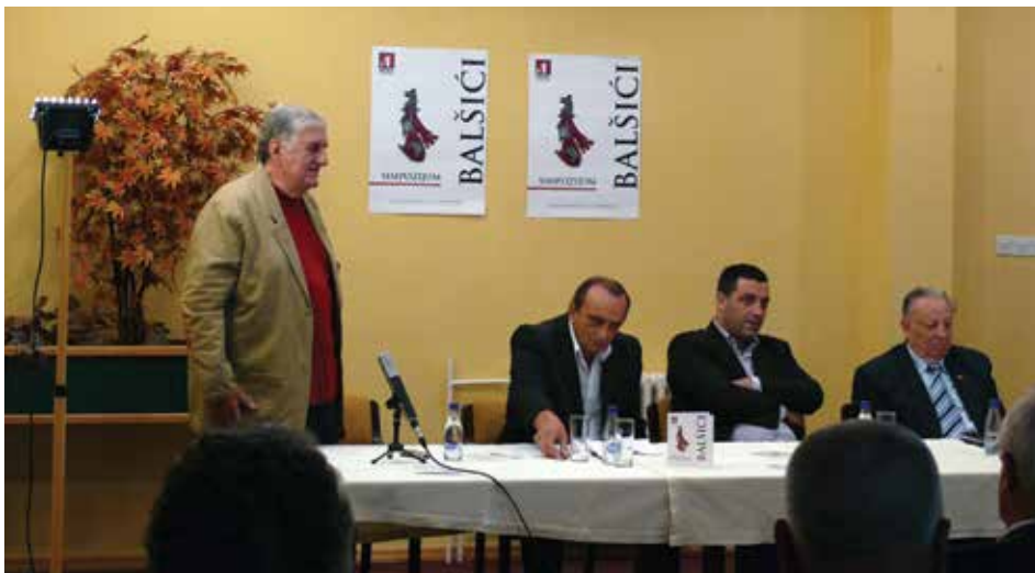
Sa naučnog skupa Balšići , Ivanova korita, 21. 09. 2011. godine