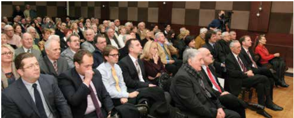
Predstavnici Matice na svečanosti Nacionalne zajednice Crnogoraca Hrvatske povodom 20 godina od osnivanja, Zagreb, 2011. godina