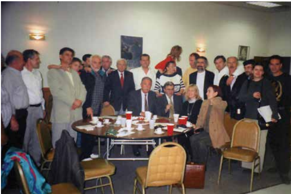
Na Susretima iseljenika, Čikago 1998. godine