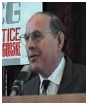
Vojislav Nikčević, na Skupštini 1999. godine