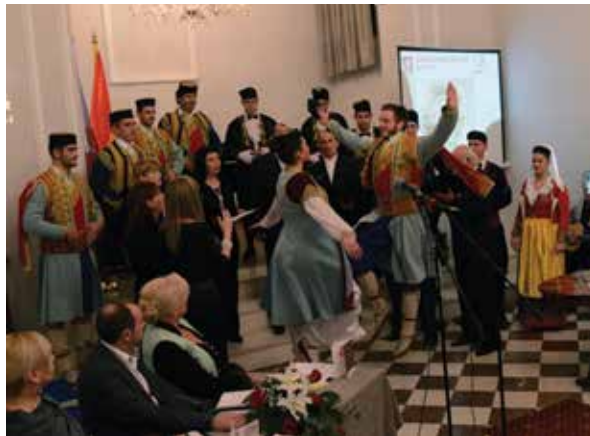
Svečana akademija povodom 200 godina ujedinjenja Crne Gore i Boke, Kotor, 2013. godina