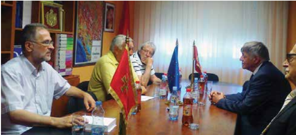
Predstavnici Matice crnogorske, DANU i PEN-a sa princom Nikolom Petrovićem, 2012. godina