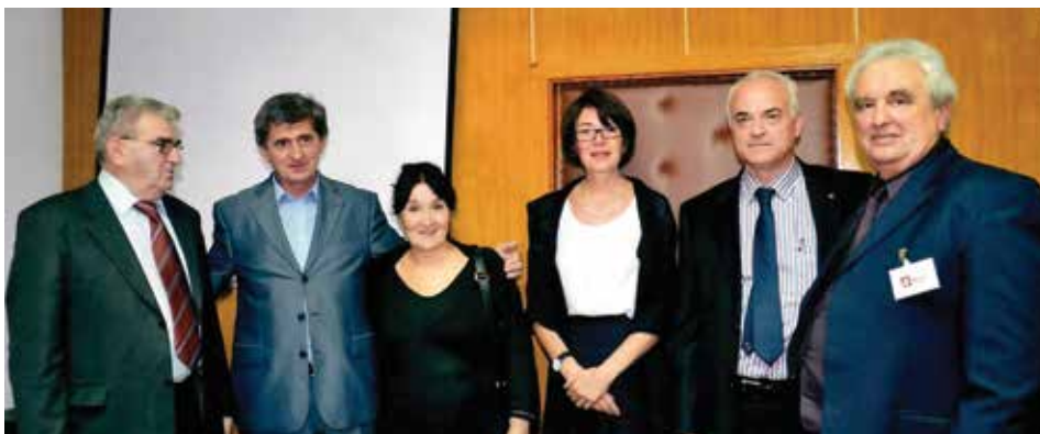
Na skupu posvećenom Ranku Radoviću, Danilovgrad, 2011. godina