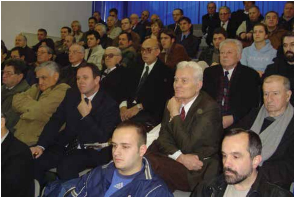
Sa Skupštine Matice crnogorske 31. 01. 2004. godine u Podgorici