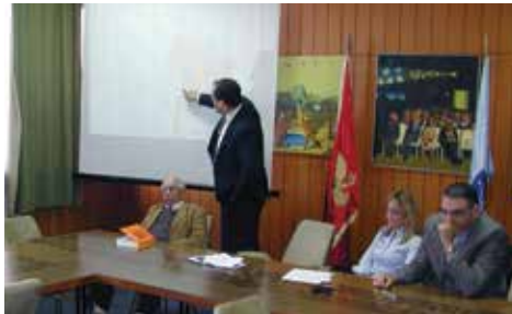
Sa tribine o crnogorskom iseljeništvu, Filozofski fakultet, Nikšić, 2014. godina