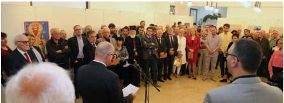
Otvaranje izložbe Kult Svetog Vladimira Dukljanskog 1016–2016 , povodom 1000 godina od smrti Kneza Vladimira, Bar, 22. 05. 2016. godine