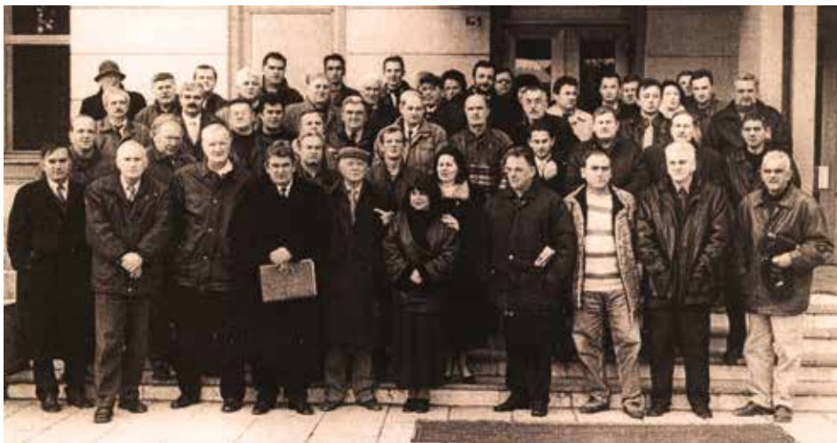
Osnivanje Ogranka Matice crnogorske u Beranama, 8. 12. 2001. godine