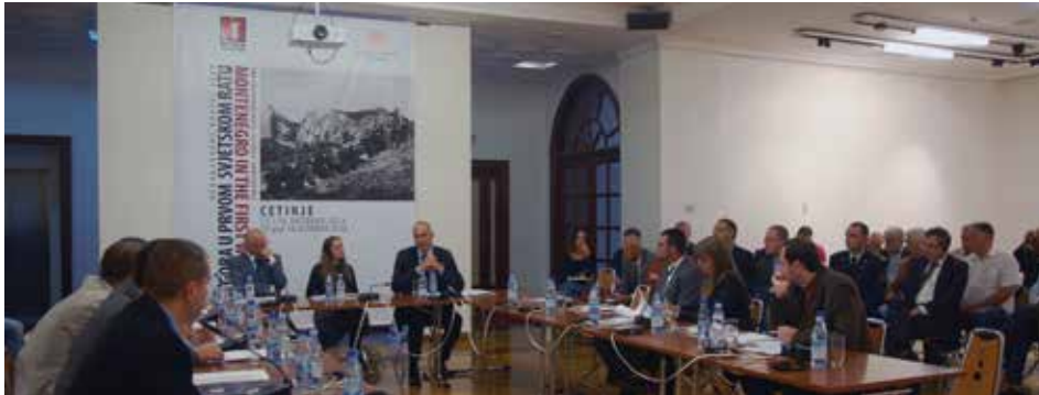
Međunarodni naučni skup Crna Gora u Prvom svjetskom ratu , Cetinje, 15. 10. 2014. godine