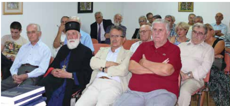
Mitropolit Mihailo u Matici crnogorskoj u Podgorici, 2011. godina