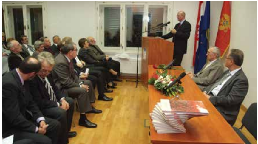
Sa promocije monografije Pokret za nezavisnu evropsku Crnu Goru , Crnogorski dom, Zagreb 2010. godine