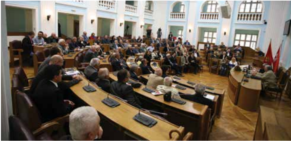
Skupština Matice crnogorske – 20 godina od osnivanja, Cetinje, 22. 05. 2013. godine