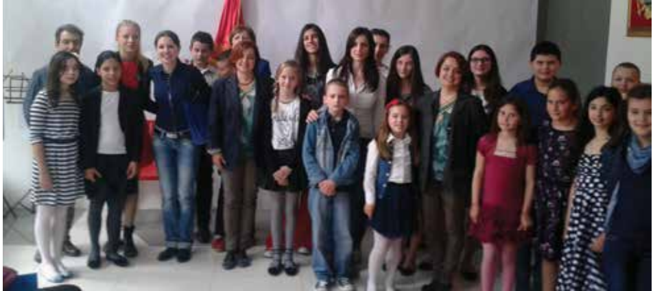
Učesnici nadmetanja Talenat za desetku , Ogranak Herceg Novi, 2016. godina