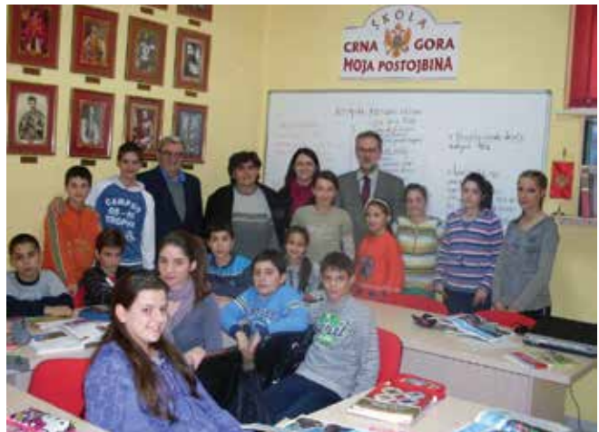
Predstavnici Matice sa decom i nastavnicima u Crnogorskom domu u Lovčencu 2009. godine