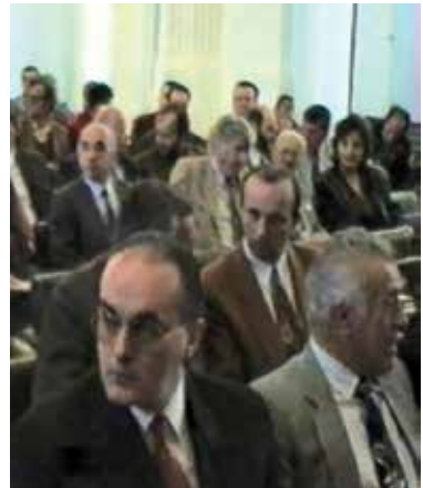
Sa Skupštine Matice crnogorske, Cetinje, 1994. godine