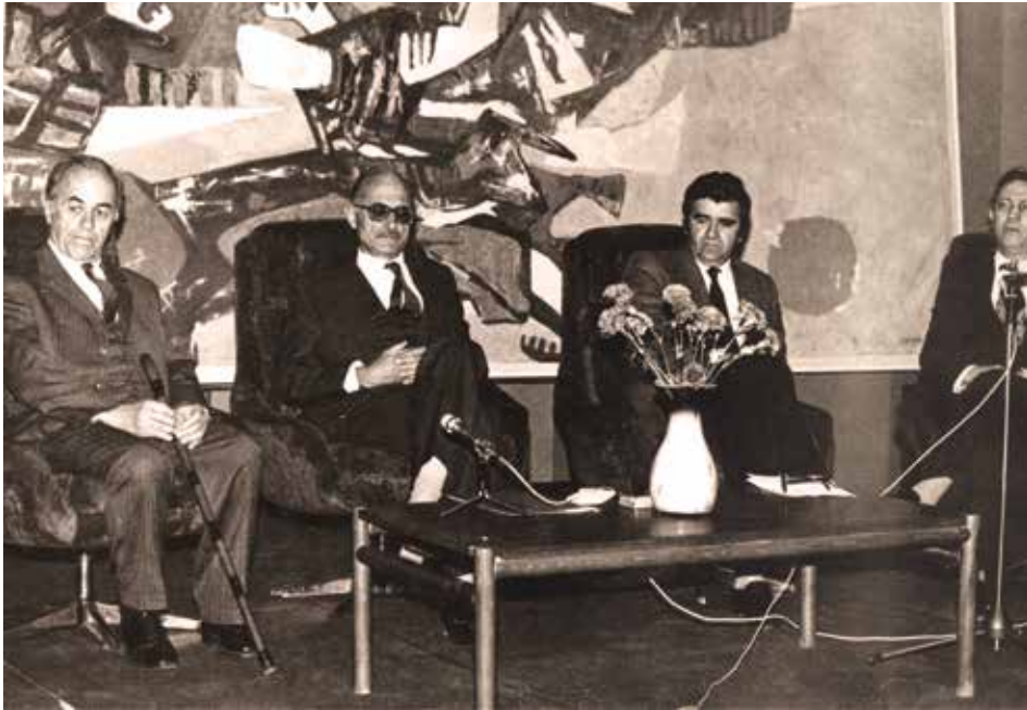
Rasprava o državnim simbolima, Podgorica, 1993. godine