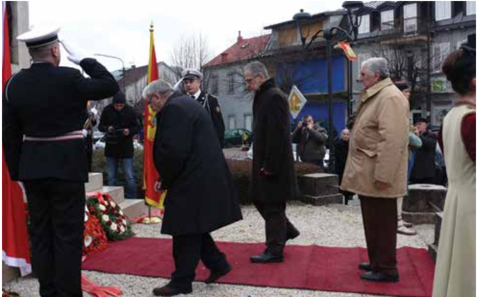
Delegacija Matice polaže vijenac na spomenik Lovćenska vila povodom 100 godina od tragedije pod Medovom, Cetinje, 6. 01. 2016. godine