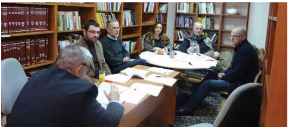
Sa šednice Upravnog odbora, Podgorica, 2013. godina