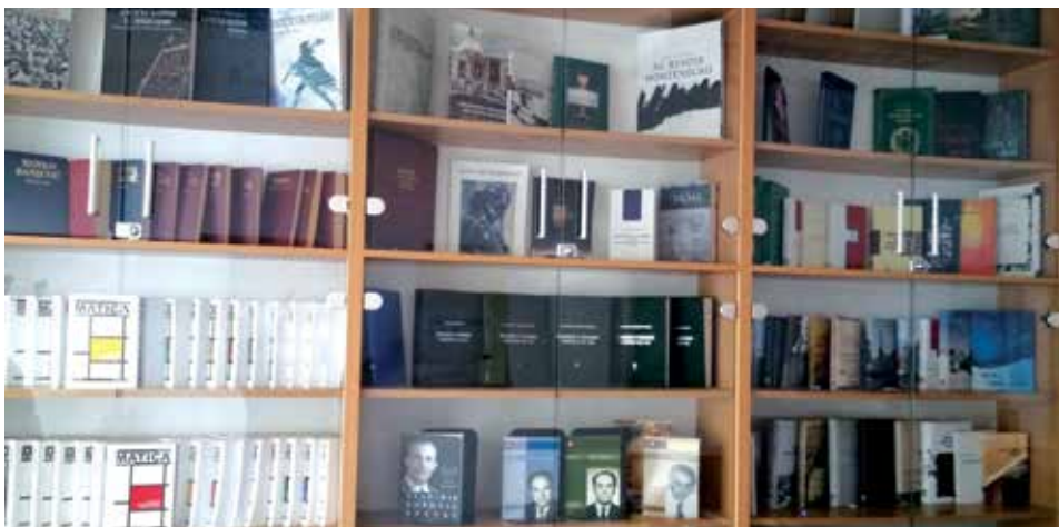
Izdanja Matice crnogorske