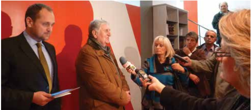
Otvaranje prostorija Ogranka u Herceg Novom, 27. 11. 2011. godine