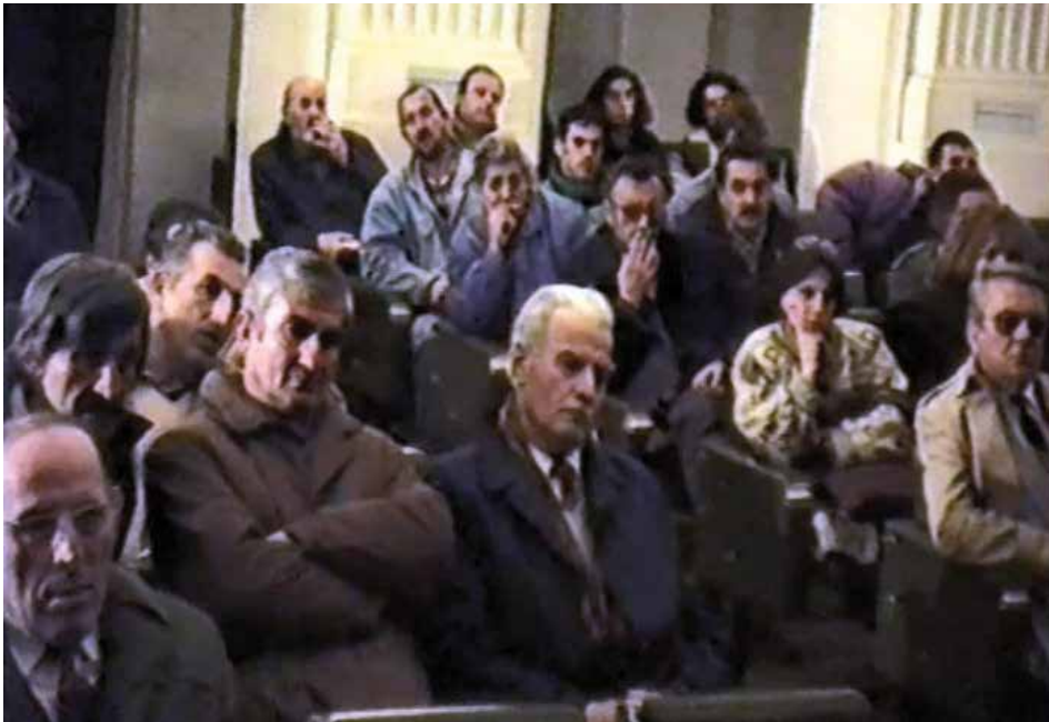
Rasprava o državnim simbolima, Cetinje, 1993. godine