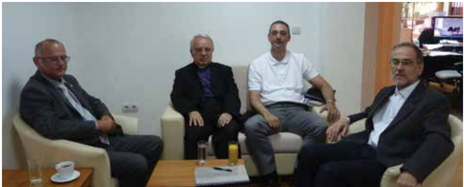
Nadbiskup barski monsinjor Zef Gaši u Matici crnogorskoj prilikom potpisivanja Ugovora o suizdavaštvu knjige Tri studije o barskoj nadbiskupiji , priređivača Ivana Jovovića, 2014. godina