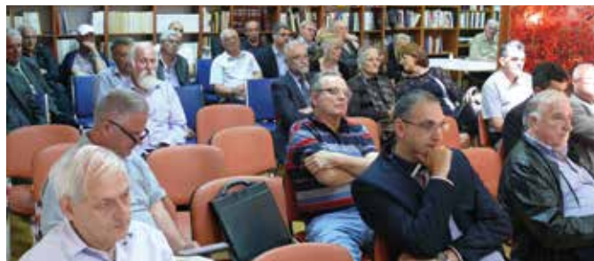
Sa Skupštine Matice crnogorske, 2016. godina