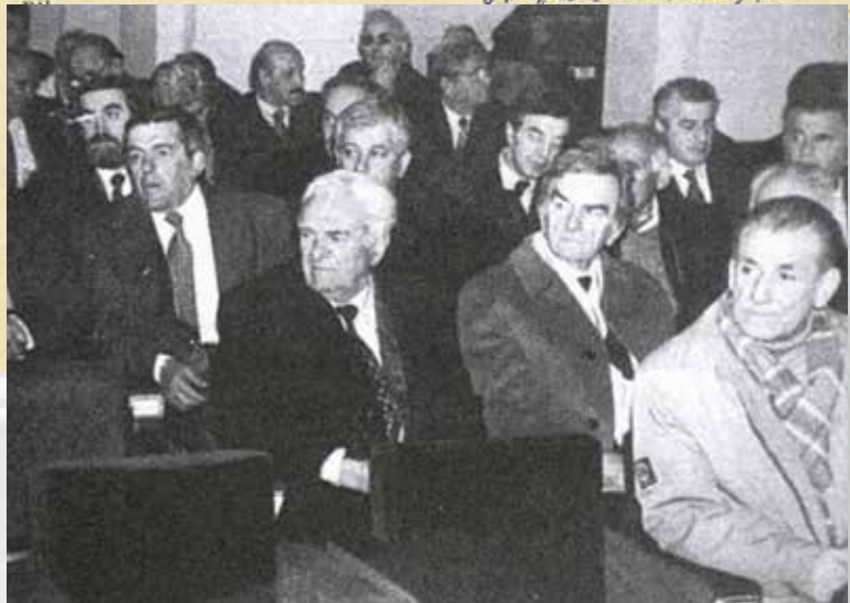
Sa Osnivačke skupštine Matice crnogorske, 22. 05. 1993. godina