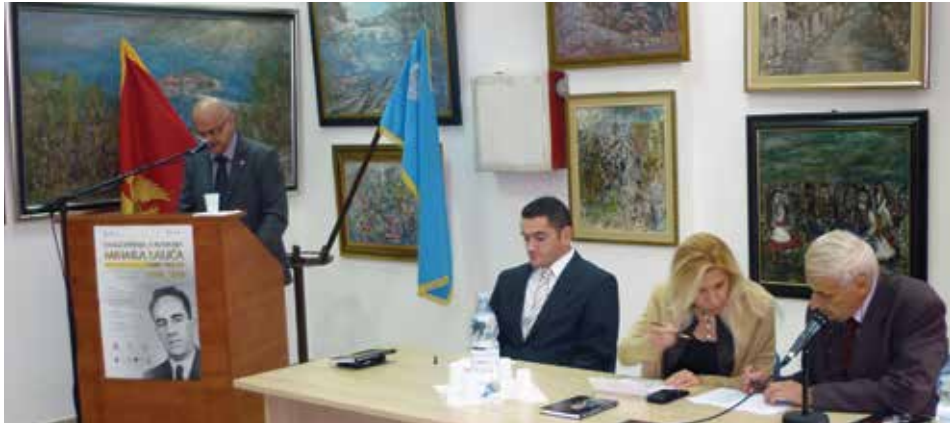
Otvaranje skupa povodom 100 godina od rođenja Mihaila Lalića, Andrijevića, 7. 10. 2014. godine