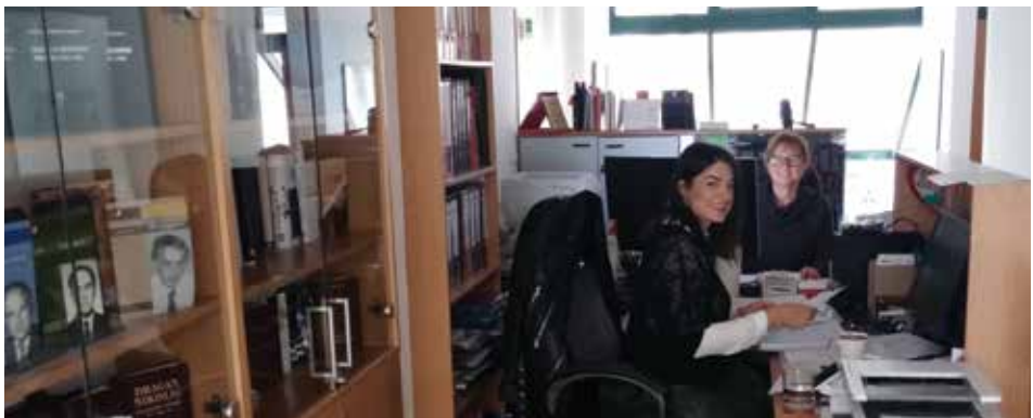
Kancelarija Matice crnogorske u Podgorici