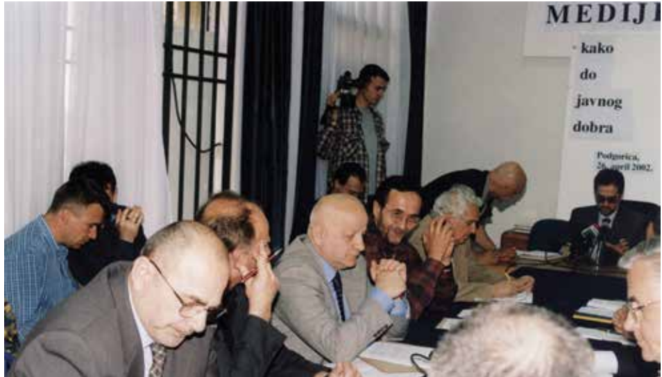
Okrugli sto Mediji – kako do javnog dobra, 26. 04. 2002. godine