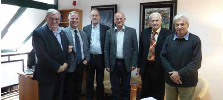
Rukovodstvo Ogranka Berane u Matici, 2014. godina