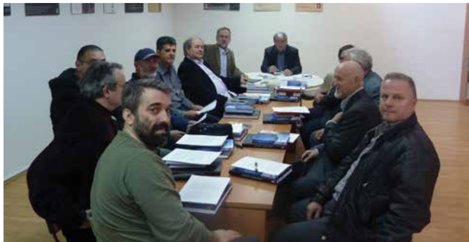
Proširena šednica Upravnog odbora Matice crnogorske sa predsednicima ogranaka, 2012. godina