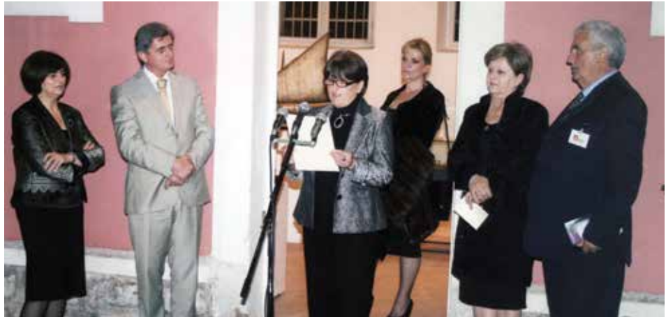
Otvaranje izložbe Nakit i(li) ukras nošnje u Boki Kotorskoj , Pomorski muzej i Ogranak Matice crnogorske Danilovgrad, 2012. godina