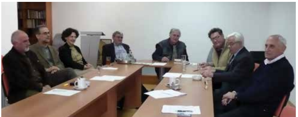
Sa šednice Upravnog odbora 2007. godine