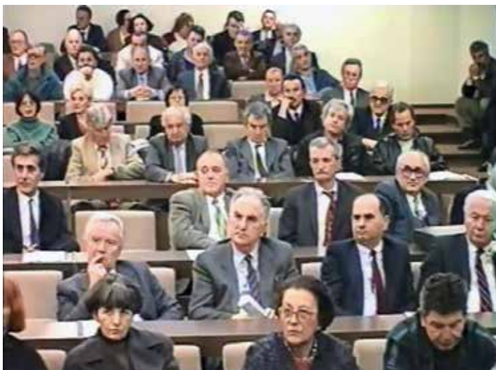
Sa Skupštine Matice crnogorske u Baru, 13. 01. 1996. godine