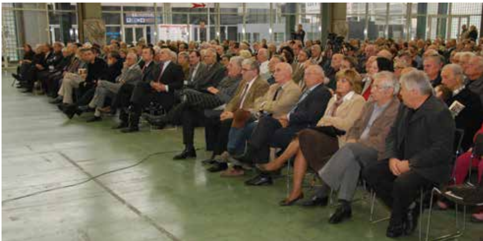
Rukovodstvo Matice na Lučindanskim susretima u Zagrebu 2009. godine