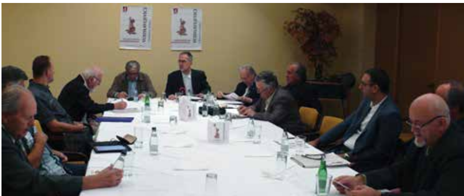
Sa naučnog skupa Vojislavljevići, Ivanova korita , 29. 09. 2012. godina