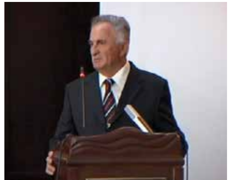
Zarija Lekić na Skupštini 2008. godine