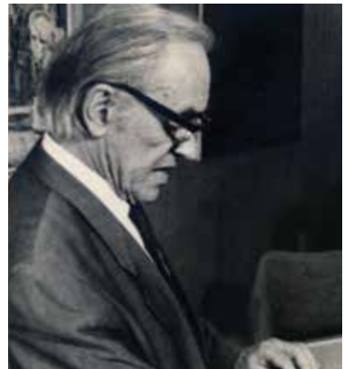
Pavle Mijović, jedan od osnivača Matice crnogorske