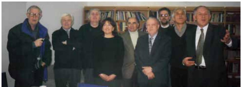
Uoči šednice Upravnog odbora 2003. godine