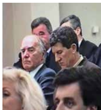
Sa Skupštine Matice crnogorske u Baru, 1996. godine