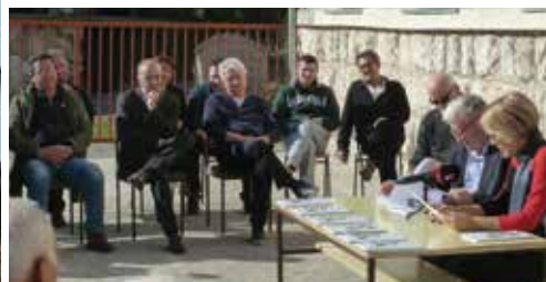
Rijeka Crnojevića, iz albuma Krsta Đuričića, predstavlanje publikacije na Rijeci Crnojevića, 2014. godina