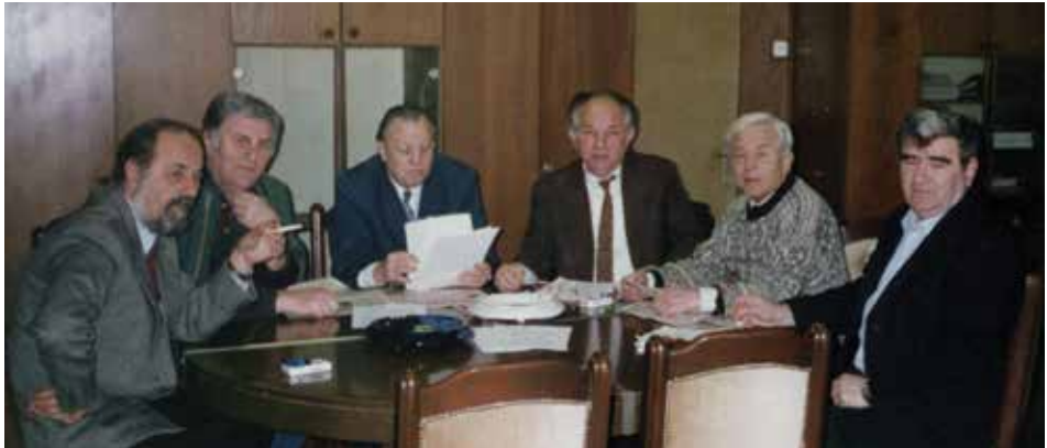
Šednica Upravnog odbora 1996. godine