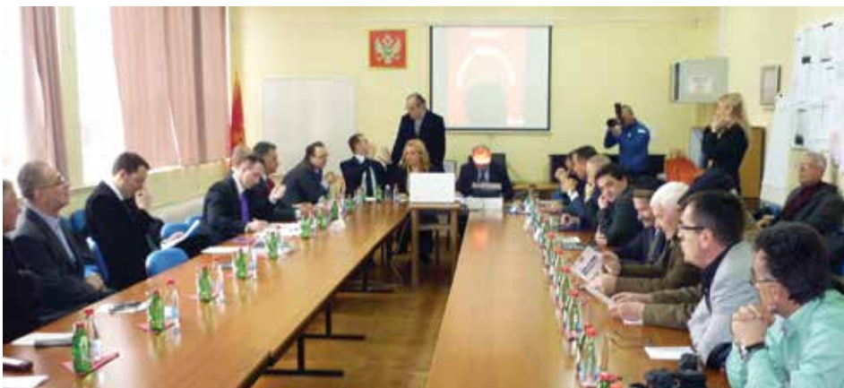
Sa otvaranja naučnog skupa 100 godina od mojковаčke bitke u organizaciji Matice crnogorske Ogranak Mojkovac uz pokroviteljstvo Ministarstva nauke, Mojkovac, 21. 12. 2015. godine