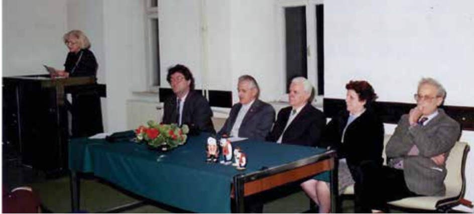
Godišnja Skupština Ogranka Matice crnogorske Kotor, 17. 01. 1997. godine