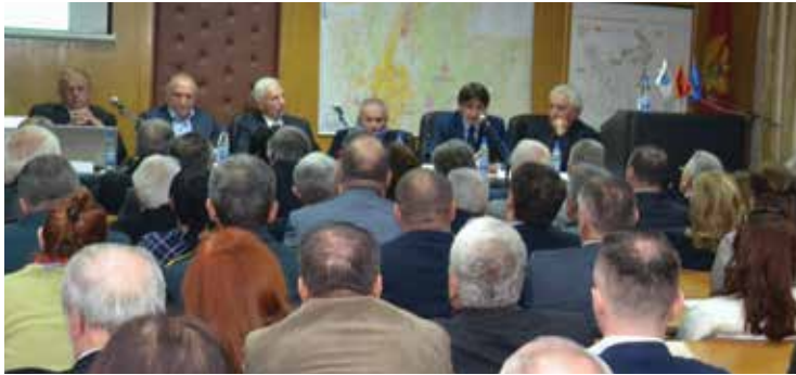
Sa skupa Medicina i zdravstvo u Danilovgradu , 2016. godina