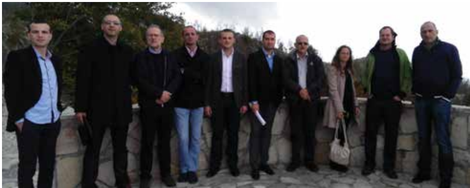
Učesnici skupa Crna Gora u Prvom svjetskom ratu prilikom obilaska Lovčena, 16. 10. 2014. godine