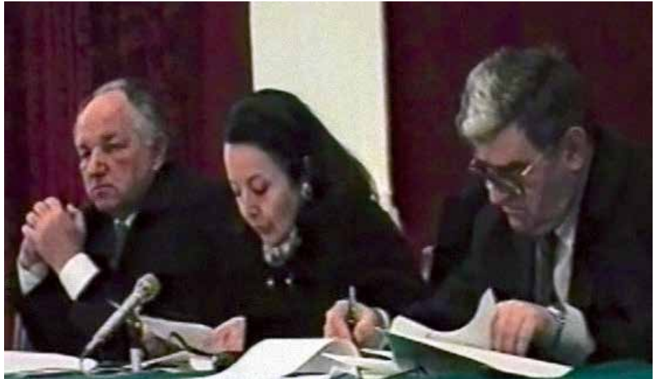
Predsjedništvo Matice crnogorske, Skupština na Cetinju, 23. 01. 1999. godine