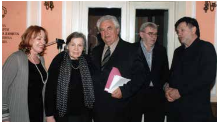
Na večeri posvećenoj Puniši Peroviću, Danilovgrad, 2011. godine