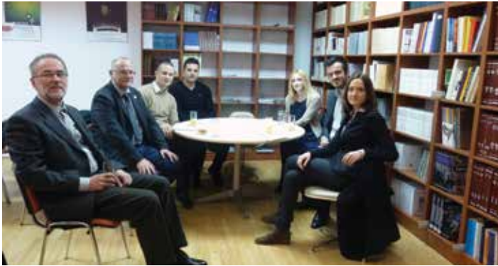
Nagrađeni učesnici prvog konkursa za esej sa rukovodiocima Matice, 2015. godina