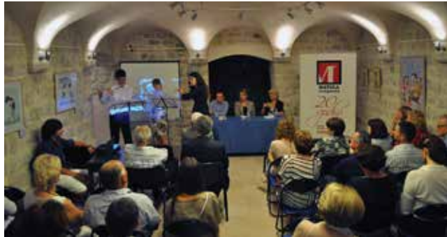
Obilježavanje jubileja 20 godina Matice crnogorske, Kotor, 2013. godina