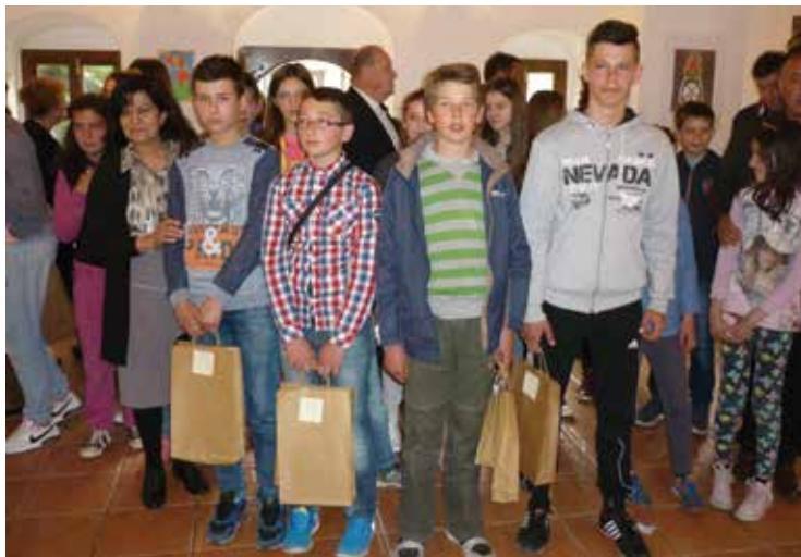
Nagrađeni učenici na konkursu Crna Gora moja domovina , Bijelo Polje, 2016. godina