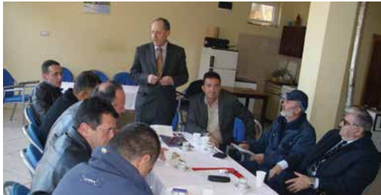
Osnivanje Ogranka Rožaje, 24. 03. 2011. godine