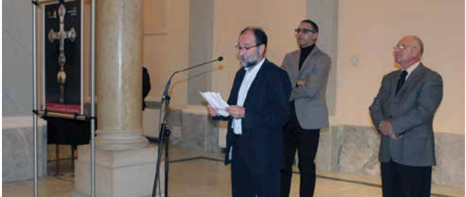
Otvaranje izložbe Kult Svetog Vladimira Dukljanskog 1016–2016 , Muzej Mimara, Zagreb, 2017. godina