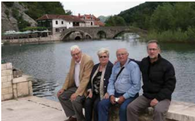
Sa prijateljima iz Nacionalne zajednice Crnogoraca Rijeka, Hrvatska, na Rijeci Crnojevića 2009. godine