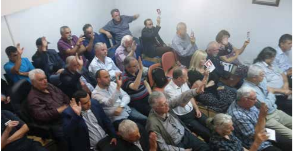
Glasanje na Skupštini, 2018. godina