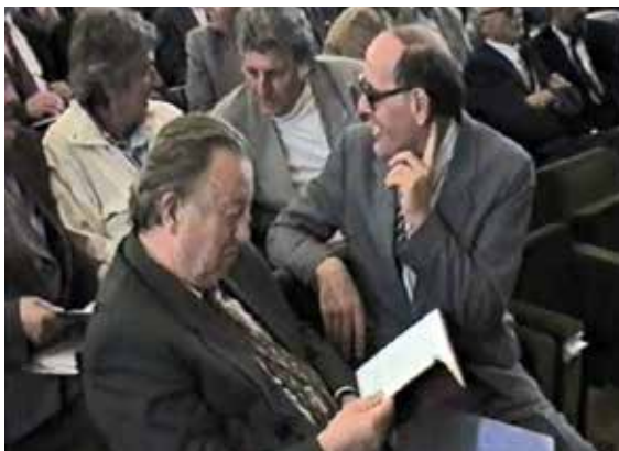
Sa Skupštine Matice crnogorske, Cetinje, 1994. godine