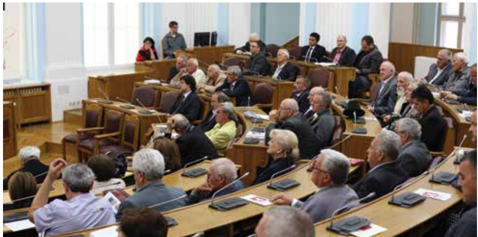
Sa Skupštine na Cetinju, 2013. godina