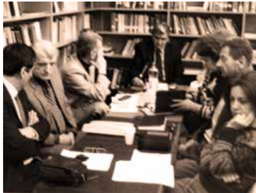
Okrugli sto Crnogorski udžbenici – kako do kvaliteta , 9. 03. 2001. godine