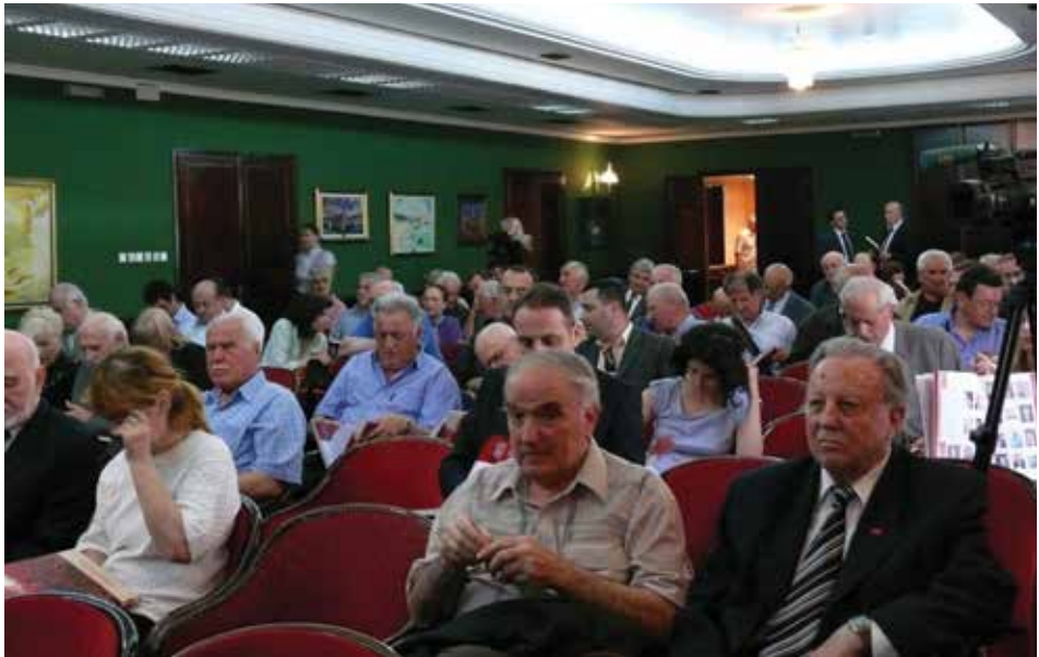
Sa promocije monografije Pokret za nezavisnu evropsku Crnu Goru , Podgorica 2010. godine