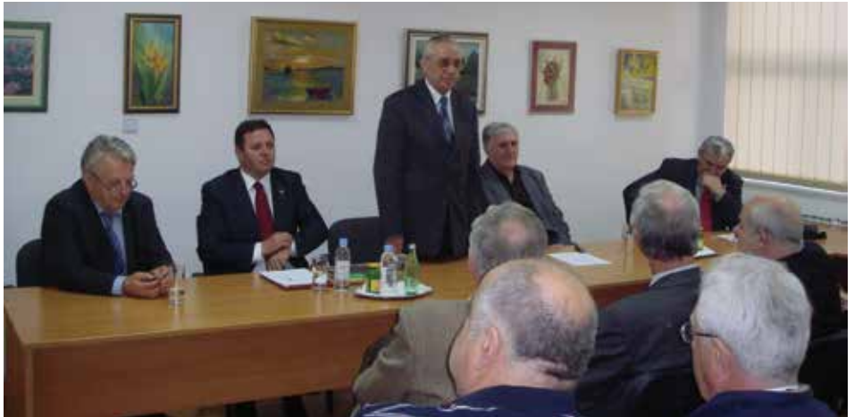
Rasprava o Ustavu Crne Gore u Crnogorskom domu, Zagreb 2007. godine