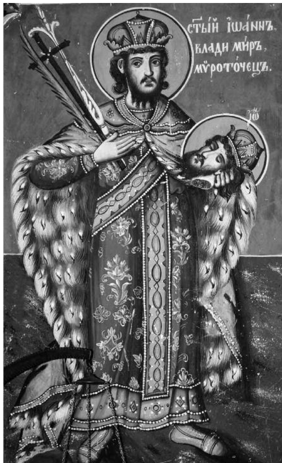
Crkva Sv. Đorđa, Manastir Rajčica blizu Debra Makedonija, 1848-1852

brojnim sačuvanim njegovim predstavama na freskama, ikonama i grafičkim bakrorezima. Kako se širio kult Jovana Vladimira, tako su probijali-prodirali i njegovi portreti, skoro devedeset na broju, koje smo identifikovali i otkrili od Tesalija i Me-teora do Svete Gore Atonske, i sjeverno sve do Budima i Beča.