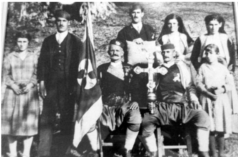
Krst Svetog Vladimira kod porodice Andrović

kneževa i osam kraljeva prve crnogorske dinastije Vojislavljevića. U genealogiji dinastije Vojislavljevića, Vladimir je uz Mihaila najprisutnije ime među muškim članovima ove vladarske kuće. Geneološko stablo Vojislavljevića bilježi tri Vladimira, od kojih jedan ima titulu kralja, a druga dva kneza.