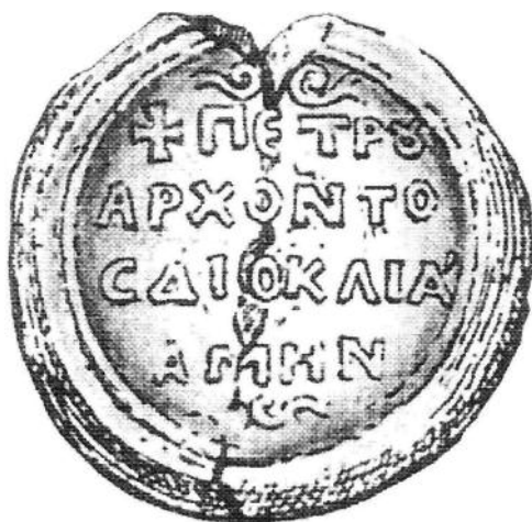
Pečat arhonta Petra

znanjem Gospoda. Dakle, dinastičko orođavanje, odnosno poznanstvo Vladimira i Kosare objašnjeno je posredstvom Svetog Duha. Kao carevom zetu vraćena mu je na upravu Duklja i pridodate još neke oblasti u današnjoj Albaniji. Kao „čovjek pravičan i miroljubiv i pun vrlina“ (Skilica) uživao je veliki ugled u svom narodu. Sa svojom ženom Kosarom živio je u „besporočnom braku“, te nije imao nasljednika. Međutim, od novog cara Vladislava, Kosarinog rođaka, koji je, izgleda, bio bogumil, te mu je smetala Vladimirova bogougodnost i popularnost, bio je na prevaru domamljen u Prespu, gdje je pogubljen i sahranjen u tamošnjoj crkvi. Dogodilo se to 22. maja 1016. godine. Sudbinski dan u povijesti Duklje predstavlja tragični kraj zemaljskog života dukljanskog kneza Vladimira. Taj žrtveni događaj označio je ujedno i početak njegovog svetiteljskog kulta.