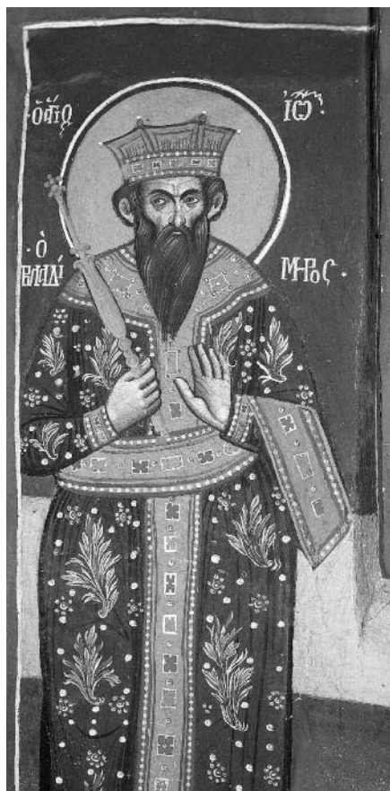
Manastir Vatopede, Paraklis Sv. Nikola, Sveta Gora, 1780.

Erazma, novomučenika Nikodima Elbasanskog (beratskog), ponovo se štampa i Žitije Svetog Jovana Vladimira na osnovu teksta venecijanskog izdanja iz 1690. godine.