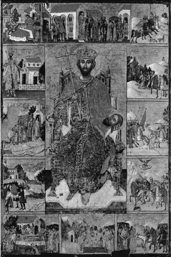
Životopis Sv. Jovana Vladimira Manastir Ardenica, Albanija, 1739.

spomenute Akolutije Jovana Vladimira pojaviti će se pod pokroviteljstvom Ohridske arhiepiskopije, što će biti od značaja za očuvanje i dalje širenje ovog kulta.