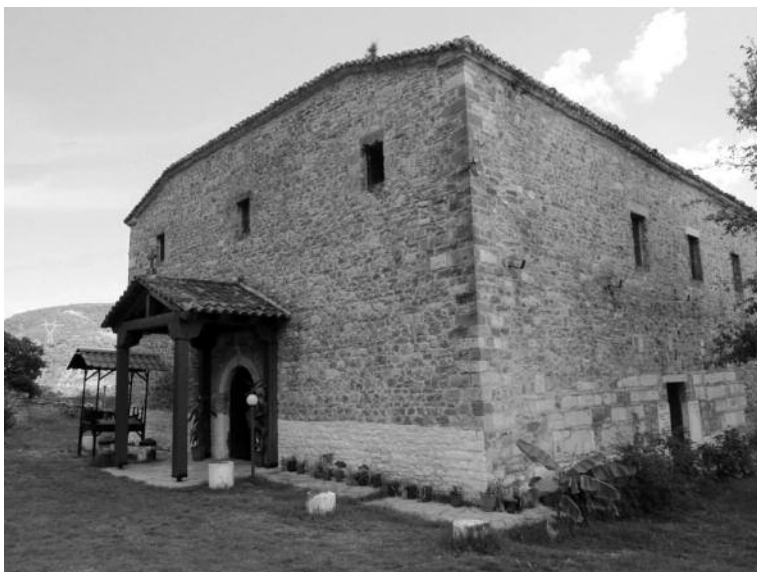
Manastir Sveti Jovan Vladimir, Elbasan

Drača. Novi prijenos Vladimirovih moštiju iz Drača u obnovljeni pravoslavni manastir Svetog Jovana/Šin Đon kod Elbasana preduzet je na inicijativu albanskog velikaša Karla Topije. Nema sumnje da je Karlo Topija prva saznanja o kultu Svetog Vladimira dobio u Draču, čiji je gospodar bio sa neznatnim prekidima od 1368. do 1387. godine. Karlo Topija, iako katolik, imao je obzira prema pravoslavnom življu koji je predstavljao veliku većinu u unutrašnjem, kontinentalnom dijelu srednje i južne Albanije. Takođe, obnovljeni manastir je bio smješten na prostorima koji su bili duhovno i crkveno potčinjeni Ohridskoj arhiepiskopiji.