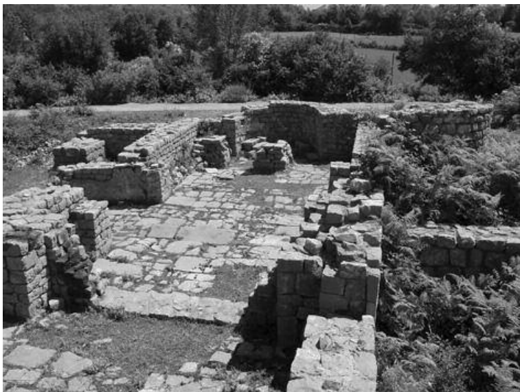
Manastir Prečista Krajinska

budućim događajima biti od presudnog značaja na državnu i duhovnu orijentaciju Duklje, s obzirom da će zbog direktne konfrontacije sa vizantijskim dvorom, knez Vojislav silom inercije biti okrenut ka Rimu. To će tektonski poremetiti odnose, jer će Duklja od sredine XI stoljeća postati najača slovenska država na ovom dijelu Balkana i Mediterana.