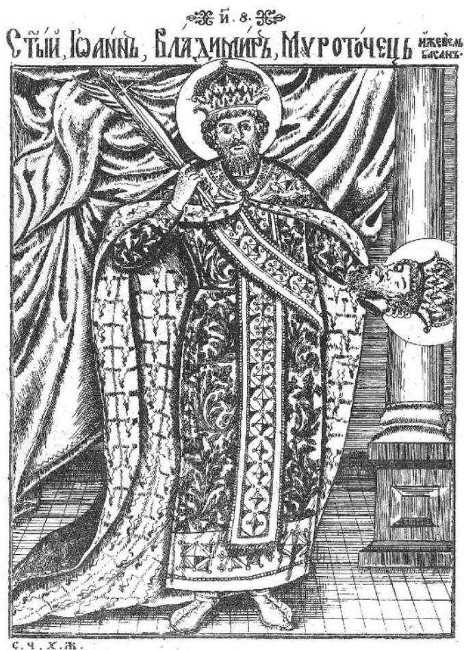
Stematografija, autora Hristifora Žefarovića, 1741.

nastala je na osnovu starijeg predloška na slovenskom jeziku. Po ocjeni dijela naučne javnosti, Žitije Svetog Vladimira valjalo bi tražiti u periodu između 1075. i 1089. godine. Ono je imalo da posluži kao temelj nove dinastije, nakon što je dukljanskim vladarima priznata kraljevska titula i utemeljena nadbiskupska