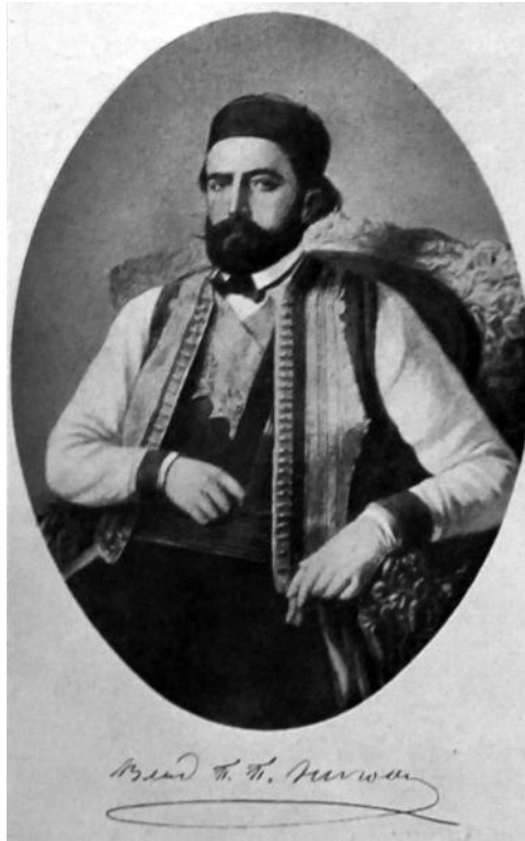
Vladika Petar II Petrović Njegoš

stekne saznanja o šahovskoj igri Njegoš je možda mogao imati na Cetinju ubrzo po povratku sa školovanja u Toploj. Naime, 1827. godine u Crnu Goru dolazi Sima Milutinović Sarajlija, koji će jedno vrijeme vršiti dužnost sekretara kod mitropolita Petra I i pružati određena saznanja mladome Radu Tomovome. Može se pretpostaviti da je, između ostaloga, Njegoš od Milutinovića mogao čuti nešto i o šahovskoj igri. Napomenućemo da postoje ozbiljne indicije kako je šah znao da igra i Vuk Stefanović Karadžić, koji je poslije susreta sa Njegošem, u Beču 1833. godine, dolazio u Crnu Goru 1834. i 1836. godine.