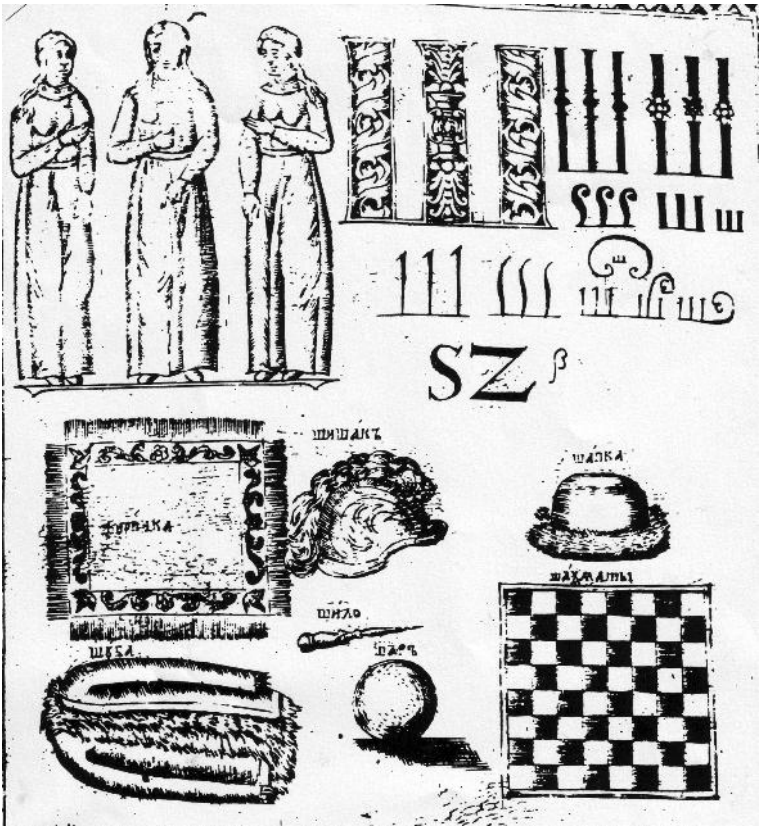
Stranica bukvara sa šahovskom tablom