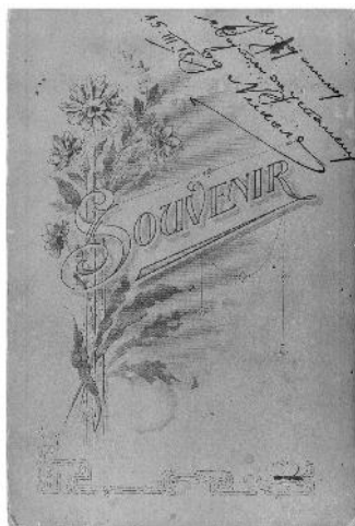
Atelje Đonović- Vujović, Cetinje 1918, kolekcija IFCG

i u onima koje su na prvi pogled najjednostavnije i najprirodnije, oseća se određena unutrašnja izvještačenost, izvjesno naivno i komično samoisticanje.