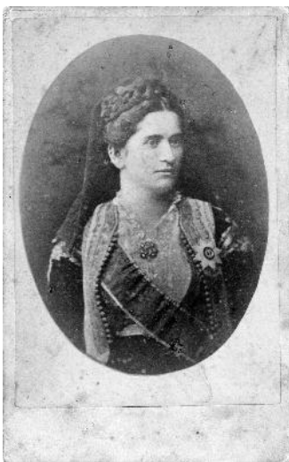
Nepoznati fotograf, Kraljica Milena, albumenski portret formata vizit karte

sedamdesetih i osamdesetih godina, da u veličini vizit karte i kabinet formata rade i biste i dopojasne portrete na neutralnoj pozadini, poput albumenskog portreta formata vizitkarte kraljice Milene nepoznatog fotografa.