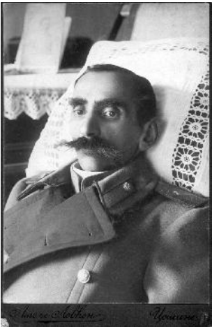
Brigadir Stevo Jovičević na samrti, Cetinje, početak 20. vijeka, vlasništvo Stevice Jovičevića

Proglasenjem knjaževine i potrebom što brže emancipacije Crne Gore u svakom pogledu insistiralo se na iskorjenjivanju raznih primitivnih obreda, navika i zastarjelih običaja. Inicijativom i strogošću u primjeni naredbi knjaza Danila na Petrovdan 1859. godine, šečenje glava je okarakterisano kao kukavičluk, a zarobljavanje neprijatelja kao vrlina. Strogo je zabranjeno grebanje lica za umrlim, održavanje običaja takozvanih mrtvačkih trpeza i vjerivanje dece. 5 Progresivan značaj te dvije naredbe ne treba mnogo dokazivati. Visoki troškovi sahrane vrlo teško su pogađali veliki broj siromašnih porodica, pored ostalih negativnih posljedica koje je taj običaj imao.