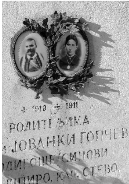
Nepoznati autor, fotografije na nadgrobnoj ploči, 1911.Oraovac, Boka Kotorska

Nošnje i pojedini djelovi imali su značaja i u vrijeme posmrtnih ceremonija i žalosti, ne samo kao dio posmrtnih običaja, već i praznovjerja. 12 Tako, na primjer, Medaković zapisuje sljedeće: „Za cijelu godinu oni korotuju mrtvoga. Muški omaste crnom mašću kapicu i pas i kružat, neki pak izvrnu kapicu, a žene omaste crnim maramama i opregljaču.“ 13